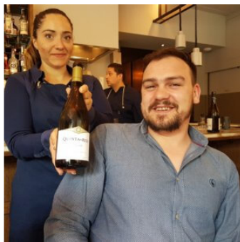
Wijnmaker Quinta Da Rede

Met een gemiddelde temperatuur van 17,4 graden gedurende het groeiseizoen is het te vergelijken met het weer in de Bordeaux . Het verschil is dat er in de Douro meer zonuren aanwezig zijn en dat er minder neerslag valt. Overdag kan het wel 38 graden worden!? Om een witte wijn te maken die fris blijft met mooie zuren, moet daarom zeker de hoogte opgezocht worden. Dit verklaart waarom de rode wijnen van constantere kwaliteit zijn dan de witte wijnen. De Douro rivier die door het hele gebied stroomt, biedt verkoeling en daar worden we allemaal vrolijk van.